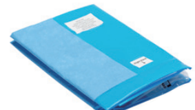
尻当てドレープ付き排液回収ポーチ