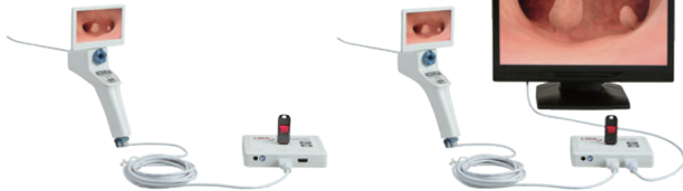
使用環境に合わせた接続